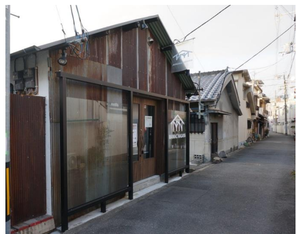
写真 1 蒲生四丁目の街並み

平成 20 年、一番初めにイタリアンのレストランを私がつくりました。そのときに、周囲から「蒲生 4 丁目でイタリアンを出店させるとは、正気か」というふうに猛反対でした。私はこのあたりにイタリアンはなかったので、大丈夫と思って一生懸命やりました。