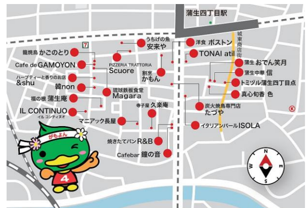
図 1 古民家再生プロジェクト MAP

城東区は人口が約 17 万 8,000 人で人口密度が日本で最も高い地域のひとつです。そのなかで特に蒲生 4 丁目から半径 2 キロに 7 万人もの人々が住んでいます。第 2 次世界大戦のときに幸いにも空襲に遭わなかったため、木造の古い住宅＝古民家がたくさん残っています。蒲生 4 丁目は城東区の中心にありながら、かつては空き家だらけのまちでした。また、この蒲生 4 丁目には城東警察署、城東区役所や保健所など、公的機関が集積していましたが、まち歩きを楽しめるようなまちではありませんでした。たまたまご縁がありまして、まちの活性化につながる仕事をしておりますので、その一端をご紹介します。