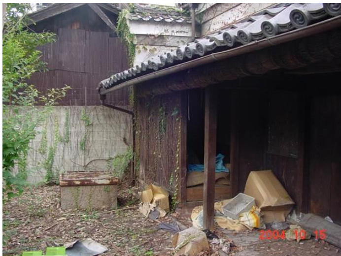
写真 7 改装前の米蔵

(写真 7)が改装前の米蔵です。築 120 年で、昔の人は建物を大事にしていたので、ワラで巻いたスベアの梁が3本も出てきました。それで(図 2)のようなプランを作りました。一部増築して、テラスもつくりましたが、米蔵ですので天井が低かったんです。そのままでは飲食店としては成り立たないので、地面を75センチ掘りました。ちょうどテーブルの天板が地面の高さになりました。耐震のことをケアするためにメッシュで鉄筋とコンクリートを入れました。このときは人生で一番頑張った時期かもしれません。