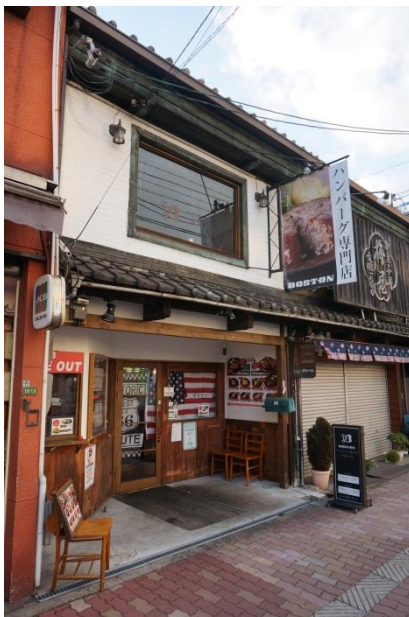
写真4 アメリカンレストラン