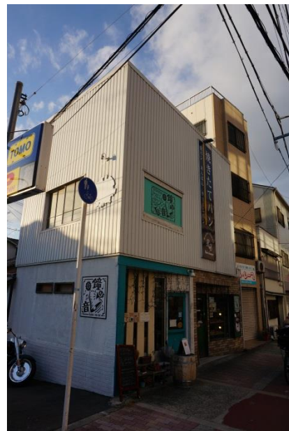
写真5 CafeBar と焼き立てパン