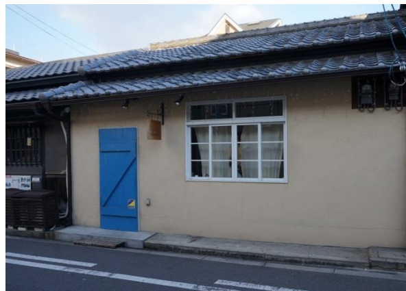
写真2 南フランス風カフェ

まちを盛り上げるために、リノベーションという「ハード」とともに「ソフト」にも力を入れています。「ソフト」の取り組みということで、いろんなイベントをしています。味噌作り体験、肉祭り、