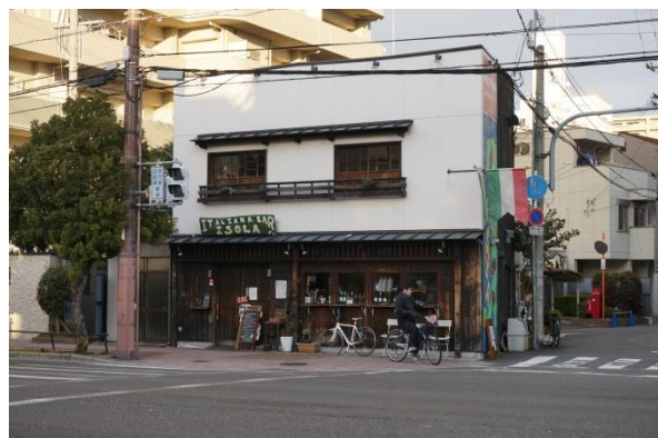
写真3 イタリアンバー