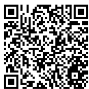
ウェブアンケートページ