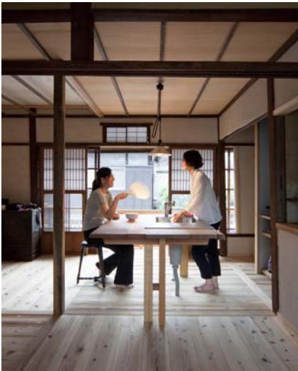
写真12 豊崎南長屋2階