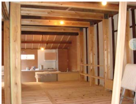
写真11 豊崎風東長屋1階