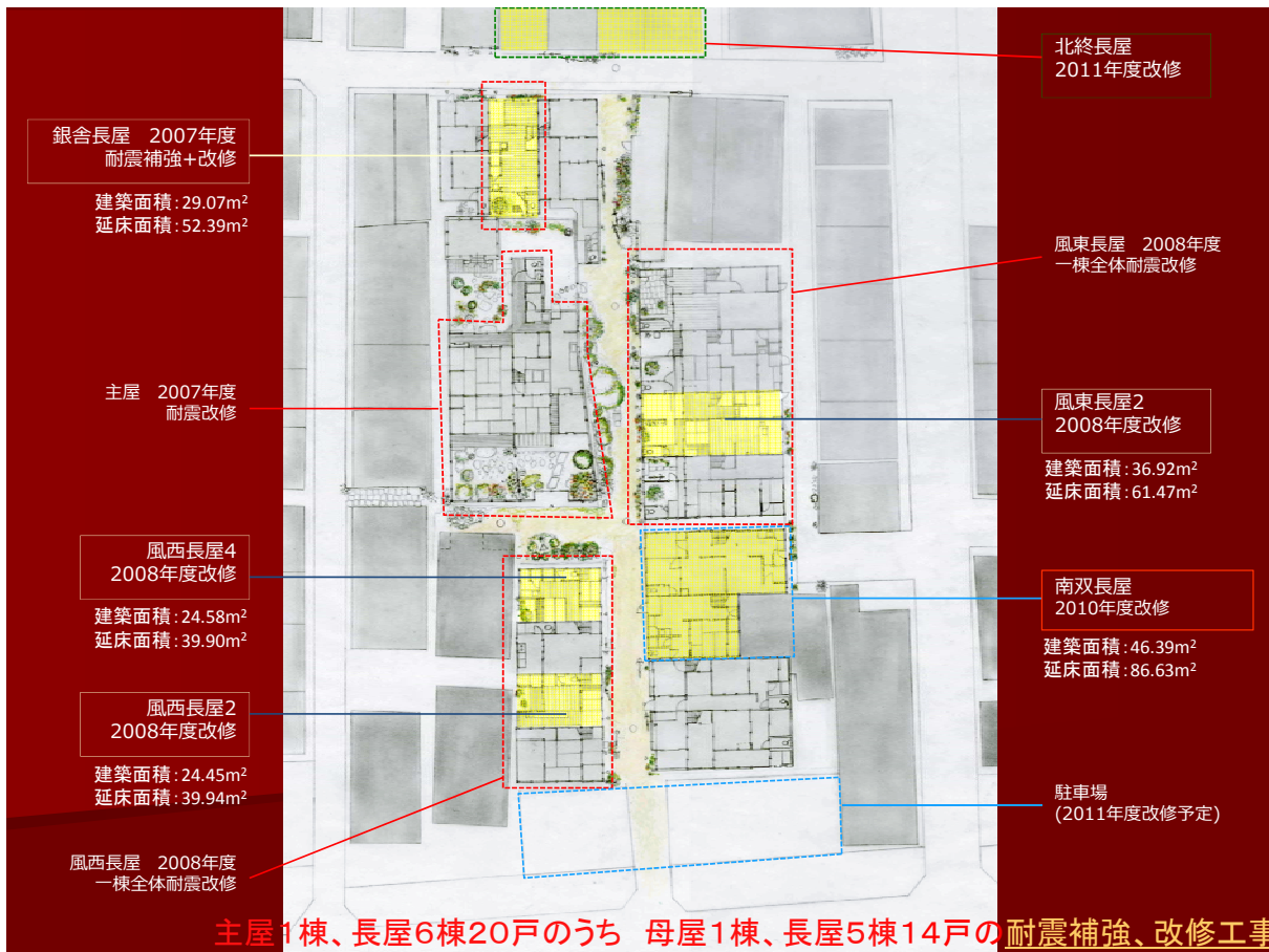
図2 豊崎長屋スポットにおける耐震補強・改修工事実績