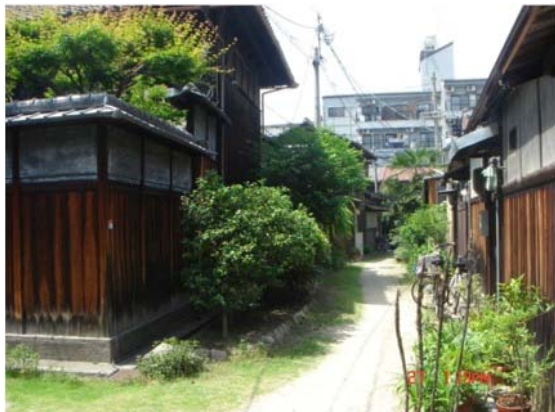
写真7 北区 豊崎長屋の路地

大阪市内の伝統的木造住宅は、戦災によって大半が焼失し、さらに、近年は老朽化による建替えやマンション開発によって急速に姿を消しつつある。このような状況にもかかわらず、ここでは主屋と長屋建ての貸家、地道の路地（ろーじ）が一群として存続し、他にはみられない魅力的な景観を保っている。