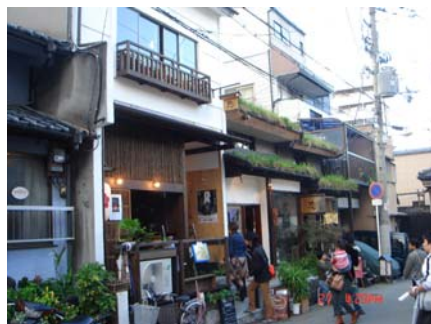
写真5 中央区空堀の店舗「惣」