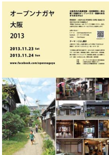
写真13 オープンナガヤ大阪2013 チラシ