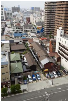
写真8 豊崎長屋の鳥瞰