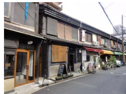
写真1 大阪型近代長屋スポット (阿倍野区)