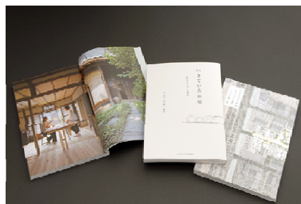
写真9「いきている長屋 大阪市大モデルの構築」