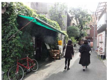
写真4 中崎町の「Salon de AManTo 天人」