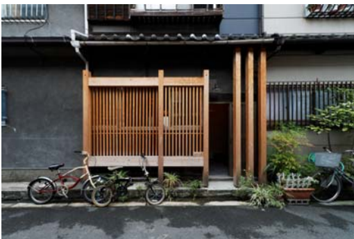
写真10 豊崎銀舎長屋