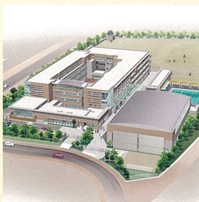
※箕面市立彩都小中一貫校イメージパース

小中一貫校は、授業面では9年間で、4年、3年、2年で分けます。6年間ではなく、最初の4年間で基礎的なことをしっかりと学習します。そのあとの5年、6年、中学1年では、小・中学校の教員が課題を共有し、共同でカリキュラムを作成したり、小学校に中学校の先生が教科